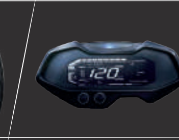
Güncellenmiş Yeni Gösterge