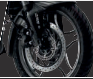
Çift Kanallı Ön Arka ABS