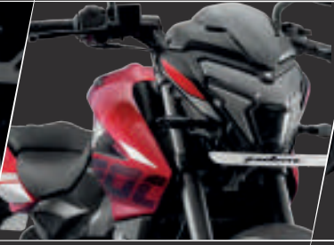
Ön Ters Çatal Süspansiyon