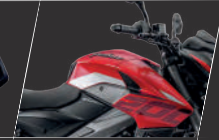
Agresif Kaslı Stil/Tasarım