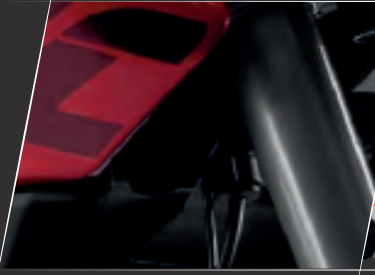
3 Bujili, 4 Valfli DTS-i Motor